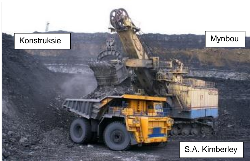
[Aangepas uit Internet Cartoons]

4.3 Bestudeer die onderstaande prentjie en beantwoord die vrae wat volg: