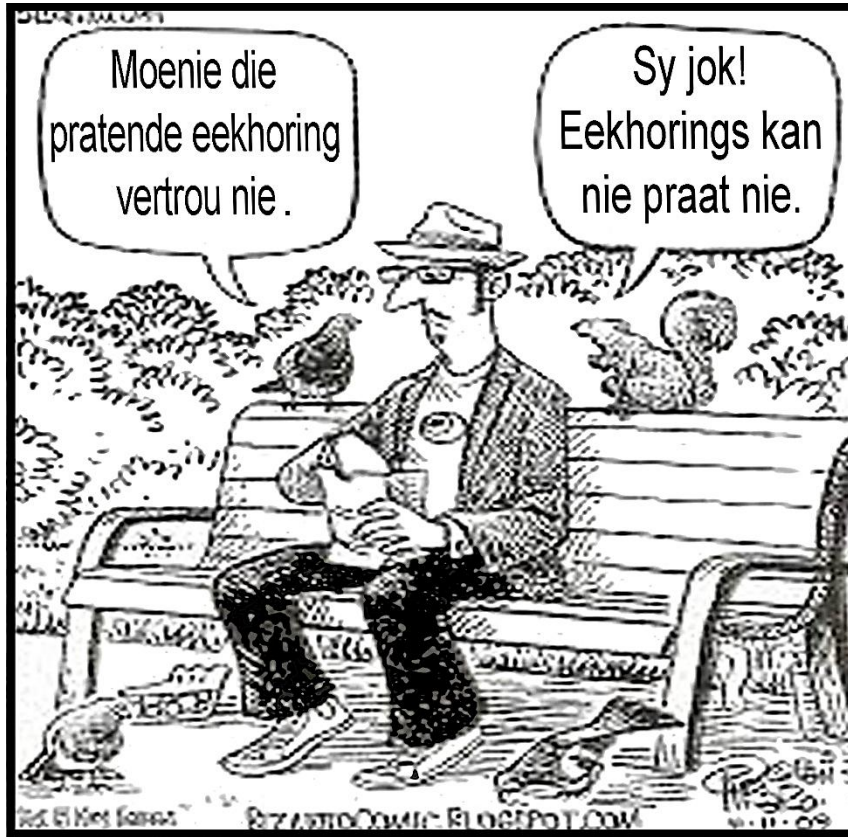
[Uit: https://www.google.co.za/search?q=afrikaans+cartoons ]

Die vrae wat volg, is op die prent hieronder gebaseer.